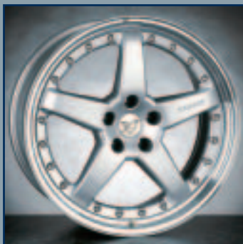
HAMANN 19 Zoll Leichtmetallrad Design “PG3” HAMANN 19 inch light alloy wheel design “PG3”

No HAMANN car or tuning part is delivered to the consumer before passing hard test and TÜV homologation. Most important of all, is to achieve maximum quality during the development and manufacturing process.