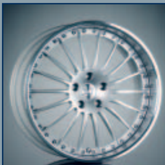
HAMANN 19 Zoll Leichtmetallrad Design “ANNIVERSARY II” HAMANN 19 inch light alloy wheel design “ANNIVERSARY II”

Mehrteiliges Leichtmetallrad, Fünf-Speichen-Design, Ausführung: Silber/Felgenhorn hochglanz poliert Split-rim light alloy wheel, 5-spoke-design, spider painted silver, polished flange